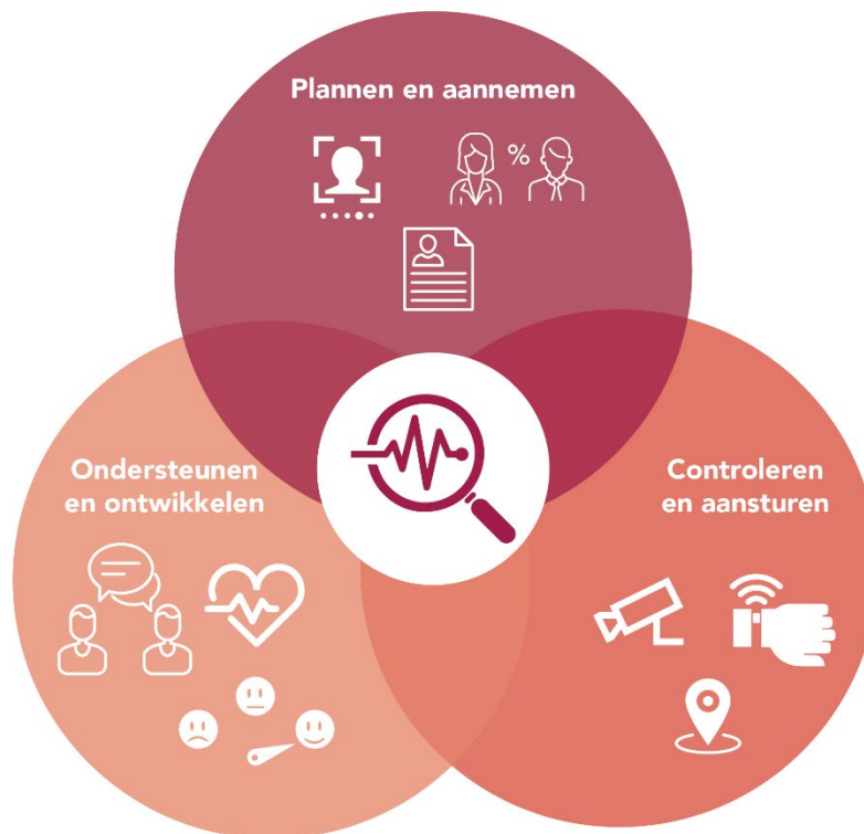
Figuur 1 Drie doelen van monitoringstechnologie