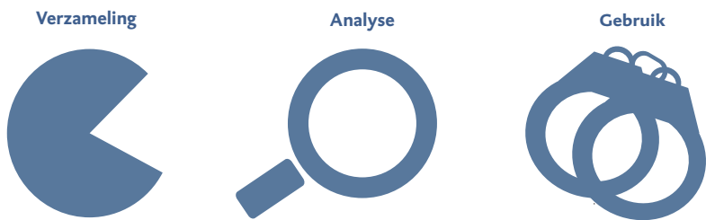
Figuur 1.1 De drie fasen van Big Data-processen

Deze drie fasen van Big Data-processen vereisen andere, deels nieuwe waarborgen, die in de loop van dit rapport verder worden uitgewerkt. In de rest van deze paragraaf schetsen we zeer kort de voornaamste overwegingen en aanbevelingen van de raad, die in hoofdstuk 6 in meer detail aan de orde komen.