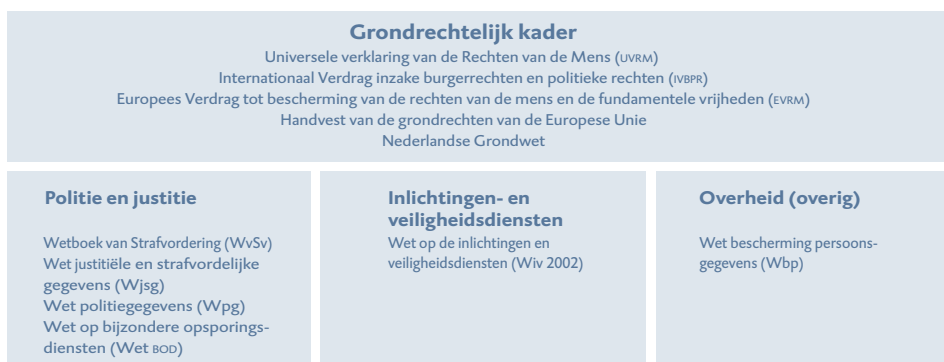
Figuur 5.1 Juridische kaders voor gegevensverwerking binnen het veiligheidsdomein

Er zijn drie verschillende regimes die de belangrijkste organisaties in het veiligheidsdomein aansturen en inkaderen: die voor politie en justitie, die voor de inlichtingen- en veiligheidsdiensten en die voor andere overheidsinstanties, die onder de werking van de Wbp vallen. 1 Alle drie de regimes vertrekken vanuit de fundamentele rechten zoals vastgelegd in internationale verdragen, het Handvest van de grondrechten van de Europese Unie en de Grondwet. Figuur 5.1 biedt een schematische weergave van deze kaders.